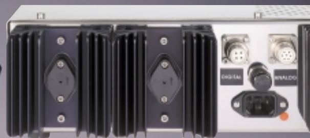
Endstufen-Feeling: Insgesamt vier Leistungstransistoren gehören zu einer außergewöhnlich sauberen und präzisen Aufbereitung des Netzstroms