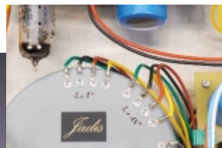
Trafo-Connaissseure: Auch die Netztrafos fertigt Jadis im eigenen Haus. Oben im Bild: die zwei Röhren der Audio-Hochspannungsregelung