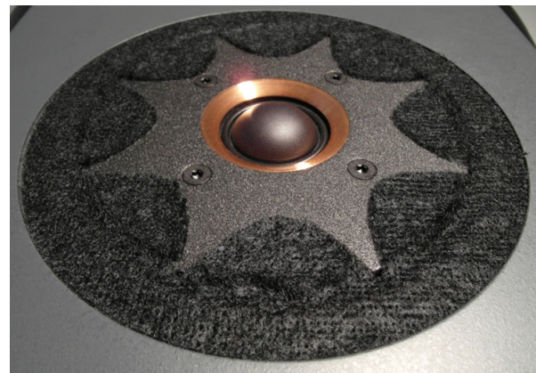
Der Antrieb der Seas-Kalotte basiert auf einer radialen Anordnung mehrerer Neodym-Einzelmagnete, was Reflektionen zurück zur Membran minimiert. Zudem spielt sie recht tief herunter, hilfreich für ein 2-Wege-Konzept. Das sternförmige Dämpfungsvlies soll frühe Reflektionen minimieren

Das Phänomen der „unendlichen Schallwand“ beruhe darauf, dass sich die tiefen, kugelförmig abgestrahlten Schallanteile von rück- und frontseitigem Konus auf einer Ebene treffen, die einer gedachten senkrechten Fläche entspricht, welche das Lautsprechergehäuse in halber Tiefe durchläuft. Dabei würden sich stets nur entweder Druckmaxima oder -minima begegnen, was laut Thomas Kühn eine ähnliche „abstützende“ Wirkung zur Folge hat wie eine physisch reale Schallwand.