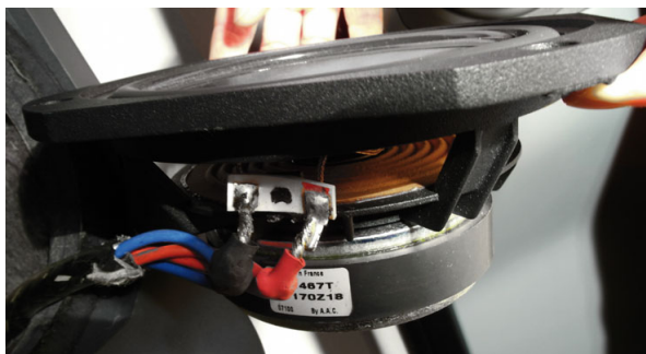
Das Membran-Material der 15-cm-Konusse von Audax wird unter anderem aus Harzen und Fasern „gebacken“ und weist eine resonanzmindernde, amorphe Struktur auf

Das Hinterbänkeltum des Tieftöners böte stattdessen aber handfeste Vorteile: „Die Schwingungen, die der Tief- sowie der Tief/Mitteltöner ins Gehäuse einleiten, sind dadurch gegeneinander gerichtet. So entstehen vor allem Druckschwankungen im Ge-