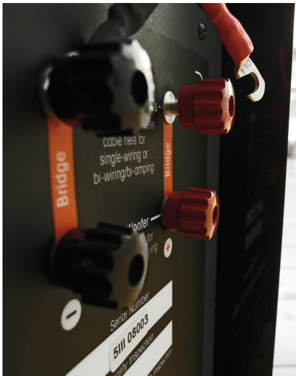
Gehört wurde vorwiegend im Bi-Wiring-Betrieb ohne Brücken mit einem Real Cable BW OFC 400

-kratzigkeit, können andererseits Undeutlichkeit oder kaschierende Schönfärberei in den oberen Lagen ebenso wenig leiden – und bevorzugen es vielmehr unaufdringlich informativ? Voilà!