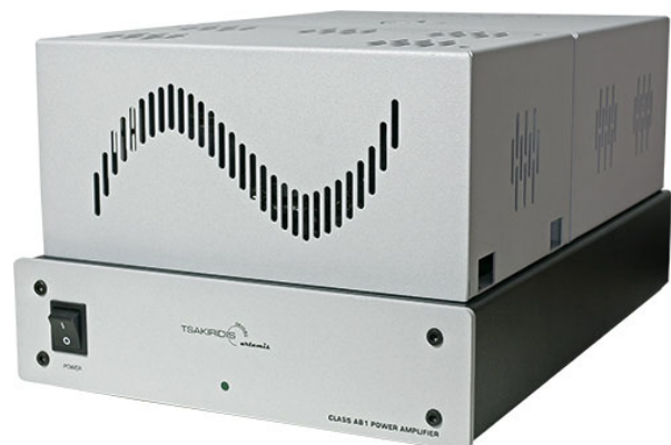
Die Tsakiridis-Endstufe besitzt natürlich auch eine Abdeckhaube

Auch der Bass hat immer genügend Schub. Er ist insgesamt zwar etwas weicher als ich es von mei-