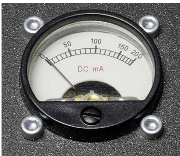
Dient der Kontrolle des Ruhestroms

Und selbst bei Klassik habe ich kaum etwas zu beanstanden. Hier kommt den Tsakiridis-Geräten vor allem ihre facettenreiche Klangfarbendarstellung zugute. Und dass die 45 Watt, die der Artemis+ aus den Röhren schüttelt, auch bei gehobenen Lautstärken und Fortissimo-Passagen nicht in die Knie gehen, sorgt auch bei lautem Hören für Entspannung. Die Preludes von Liszt (Solti, London Philharmonic Orchestra) krachen ordentlich und gehen unter die Haut, klingen aber nie angestrengt. Ok, hier liegt wieder ein Vorteil von Röhren, die, wenn sie wirklich mal an ihre Leistungsgrenzen kommen, vorwiegend harmonische Verzerrungen produzieren, was sich für das Gehör häufig „richtig“ anhört.